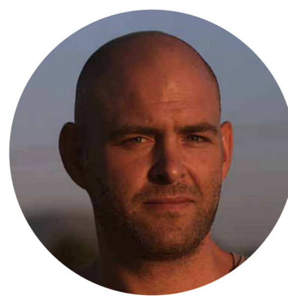
En Dolci Visfera įkūrėjas & ir Meno direktorius